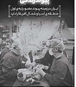
ایران در زمینه پیوند عضو، رتبه اول منطقه‌ای آسیا و شمال اقیانوس دارد