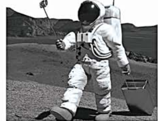
تور سفر به سیاره بدون زنان

البته چون باید احادیث و روایات را جامع و در کنار هم دید و بعد نظر داد، احتمالاً مانند خیلی از مسایل روز درباره سفر به این سیاره هم بین علما اختلاف می‌افتد و فعالان می‌توان حکم شفاف و مشخصی در این باره داد. یکی از فعالان حوزه هنر نیز تصریح کرد: قطعاً در سیاره بدون زنان کار هنری خیلی ساده تر می‌شود و سرعت تولید بالا می‌رود. چون نیاز به ظرافت به خرج دادن و تنوع رنگ و مدل در سیاره مردانه شدت کاهش پیدا می‌کند.