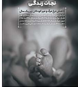
تاکتیک نثر مرگ و میر کودکان زیر یک سال در ایران