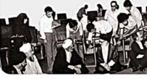
خاتم منبره گرجی در مجلس خبرگان

خاتم منبره گرجی فرد تنها از حاضر در مجلس خبرگان قانون اساسی است. او همسر یک کفایش ولی مستخران پرتشو قبل از انقلاب، گاه همراه طالقانی و گاه حتی در مدارس پیوسته است. وقتی وعده‌های برخی زنان غریبه برای مجلس خبرگان زامی شدند، برای حفظ انقلاب و با حمایت شهید بهشتی کاندید می‌شود و نزدیک ۲ میلیون رای می‌گیرد. اولین مواجهه خط تبحر با او در همان مجلس خبرگان است. نماینده‌ای می‌گوید: این مجلس گناه است. ایک زن و ۷ مرد؟! و تهدید می‌کند اگر این زن بیرون نرود ما می‌رویم! خاتم گرجی پشت تریبون می‌رود می‌گوید: من مطمئنم گناه‌نامه نمی‌کنم هر کس فکر می‌کند مجلس گناه است تشریف ببرد! می‌گوید آن مجلس سه ماهه، انداز ۵۰۰ سال زنجش داده است! و البته از حمایت یاران صدیق امام هم گفته است. درباره اش گفته‌اند. اصول مربوط به زنان با تلاش و کوشش او بود. حتی برای حذف قید "رجل" در شرایط رئیس جمهور تلاش می‌کند پیش امام می‌رود و امام می‌فرماید شما نماینده‌اید بگویید چه کنیم!؟