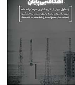
رتبه اول جهان از نظر بیشترین سرعت رشد علم ایرانی با سرعت تازه بر روی نسبت به میانگین جهانی